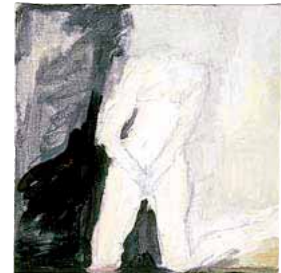
Malerei «In the Dark», 2006, Acrylfarbe und Bleistift auf Leinwand.