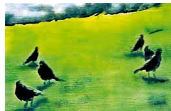
«Eiche I», 2009, Öl auf Eiche von Vera Ida Müller.

► Die Bilder von Vera Ida Müller wecken Assoziationen zu surrealen Filmsequenzen. Die Protagonisten befinden sich meist in Gruppen ohne jeglichen Bezug zueinander. Überbelichtet, verschwommen oder fast ganz im Dunkeln verschwindend entziehen sich die Motive sanft dem Betrachterauge. Die 30-jährige Zürcherin, deren Werke bereits ihren Weg in namhafte Sammlungen gefunden haben, spielt mit dem Wechsel von Licht und Finsternis, Traum und Wirklichkeit. REA