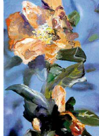
«Punica nana», 2008, Öl auf Leinwand, von Barbara Ellmerer.

► «Könnte es sein, dass die Kraft, die ein Bild entstehen lässt, dieselbe ist, die ein Blatt wachsen lässt?» Solche Fragen stellt sich Barbara Ellmerer, die mit ihrer Malerei Wahrnehmungsstudien betreibt: Winziges wird bis zum Gigantismus aufgeblasen, Fragiles mit dicken Farbschichten zementiert. Die Zürcherin, die nie ohne Digitalkamera unterwegs ist, operiert in ihren Arbeiten mit Tiefenwirkung und Kontrastschärfe und setzt Gewohntes in ungewohntes Licht. REA