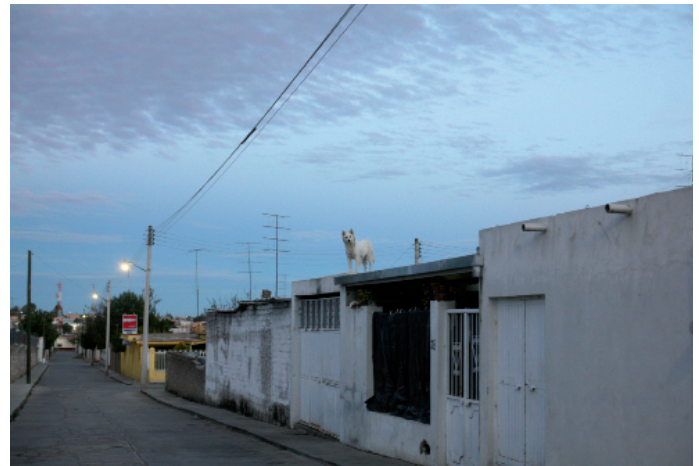
Mark Powell, White Fang, 2009 C-print, 70 x 100 cm

Galerie Nikolaus Ruziska – Die 2004 in Salzburg, Deutschland gegründete Galerie Nikolaus Ruziska konzentriert sich sowohl auf neue als auch auf etwas bekanntere Künstler. Besonderer Künstler: Dieses Jahr bringt die Galerie die Arbeiten der in Wien geborenen Künstlerin Brigitte Kowanz mit zur SCOPE Basel. Die großen und kleinen Lichtinstallationen wurden bereits auf Ausstellungen in aller Welt von prominenter Seite gefördert. In der Arbeit von Kowanz erscheint das Licht sowohl als Thema als auch als Material. Sie spielt mit verschiedenen Wahrnehmungen und der Sprache des Lichtes.