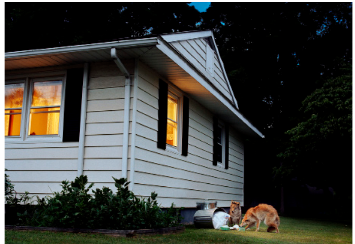
Amy Stein, TRASHEATERS , 2005 Photoprint, 76 x 95 cm

Es widmet sich der Förderung chinesischer und internationaler zeitgenössischer Kunst. Viele der hier präsentierten Künstler können beträchtliche Ausstellungszahlen vorweisen oder befinden sich gerade auf der Schwelle zu internationaler Anerkennung. Eine Podiumsdiskussion mit Arthur Duncan, Sally Chu, Victoria Lu und Dr. Caprice Horn betrachtet die Sammlung zeitgenössischer chinesischer Kunst während des weltweiten wirtschaftlichen Abschwungs.