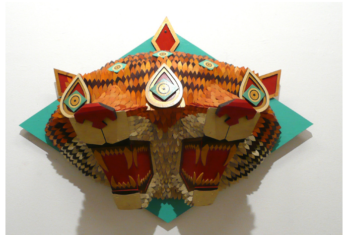
A.J. FOSIK, Double Headed Tiger, 2007 Wood, acrylic paint, 128 x 70 x 46 cm

Galerie Rätus Casty – Eine der neueren Galerien der Szene. Die Galerie Rätus Casty zeigt in erster Linie europäische Künstler, die meist in der Schweiz und in Deutschland geboren sind. Besonderer Künstler: Die Galerie Rätus Casty zeigt Arbeiten der Künstler Ekkehard Tischendorf, Irene Grau, Vera Ida Müller und Birgit Widmer. Tischendorfs beinahe apokalyptische Werke verkörpern den Gedanken an den in der modernen Gesellschaft alltäglich präsenten Schrecken. Er macht die wachsende Beliebtheit junger, moderner Künstler in Deutschland deutlich, die viel Aufmerksamkeit auf sich ziehen.