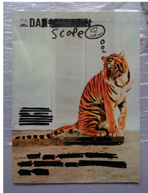
Invisible Heroes Special Project at SCOPE Basel Art Show 2009

Artfacts.net, Artnet, artnowonline, artprice, artslant, Art We Love – explore art on your own terms, Global Art Magazine, likeyou – the artnetwork, Miami Art Guide, MutualArt, re-title, Rivista Segno, Tommy Hilfiger, Whitehot Magazine, and Video Art Magazine.